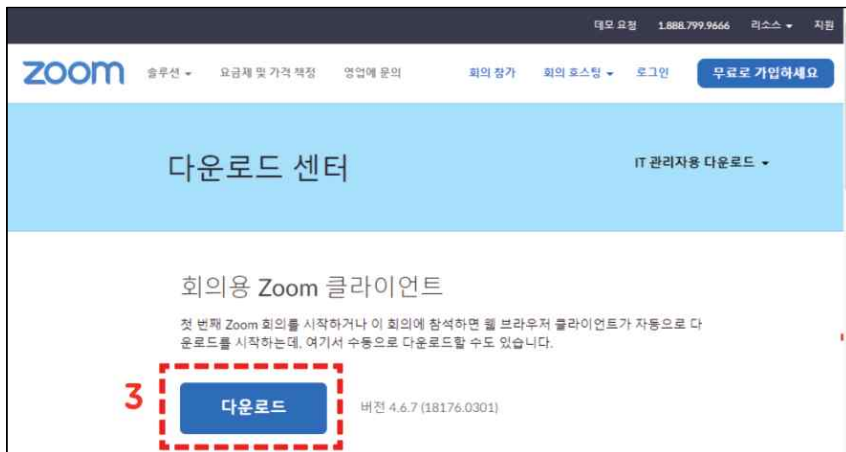
회의용 Zoom 클라이언트 설치파일을 ③다운로드 하고, 다운받은 파일을 실행하여 설치