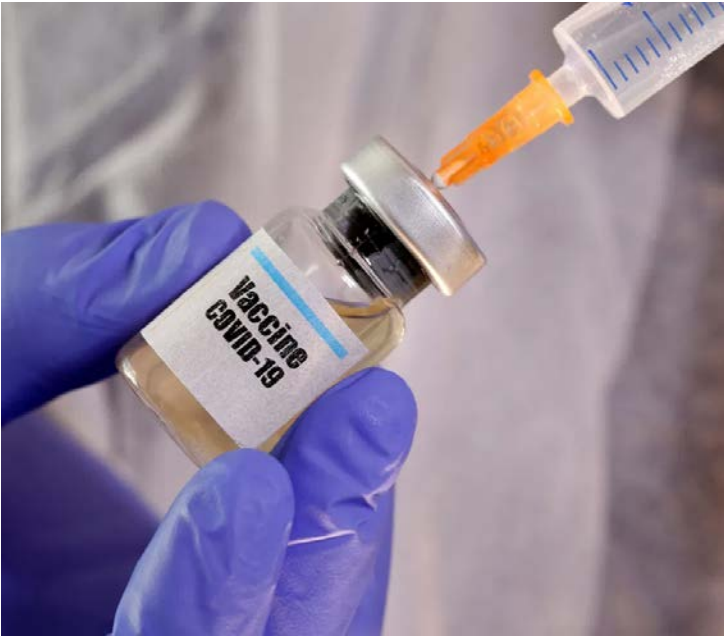
화학 백신 'Chemical' Vaccine